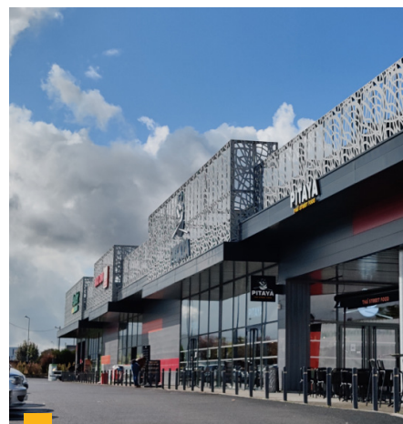
Retail Park à Tours (37)

**** Jusqu'à 2020 : TDVM. À partir de 2021 : Taux de distribution.