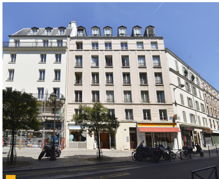
2 rue de Beccaria à Paris (75012)

Deux actifs situés à Nogent-le-Rotrou (28) et à Gruissan (11) ont été cédés en ce début de semestre pour un prix global de 4,65 M€. Votre SCPI a également vendu sa quote-part de 65% dans le centre commercial des Hauts de Clamart (92) au prix de 10,66 M€. Elle a aussi signé des promesses de vente pour 4 actifs situés à Masny-Ecaillon (59), Charenton-le-Pont (94), Fumel (47) et Bressuire (79). Ces arbitrages pourront offrir la possibilité de réinvestir dans des immeubles plus récents et plus performants.