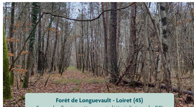
Forêt de Longuevault - Loiret (45)

Les chiffres cités ont trait aux années écoulées et les performances passées ne sont pas un indicateur fiable des performances futures qui sont soumises à l'impôt, lequel dépend de la situation personnelle de chaque investisseur et est susceptible de changer à l'avenir.