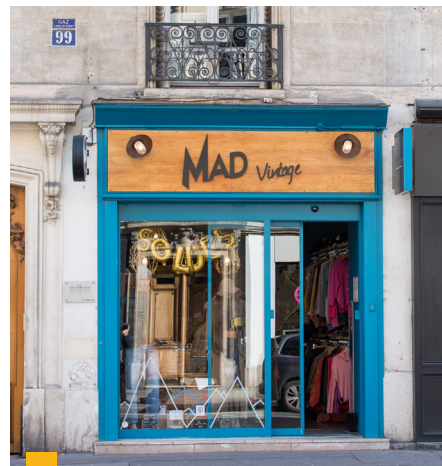
99 rue de Rennes à Paris (6 ème )

**** Jusqu'à 2020 : TDVM. À partir de 2021 : Taux de distribution.