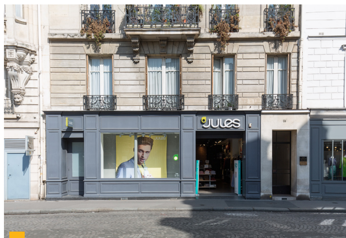
64, rue de Passy (16 ème )

Ces arbitrages étaient nécessaires pour résorber la vacance et éviter des travaux lourds, afin de pouvoir réinvestir dans de nouveaux immeubles plus récents et plus performants